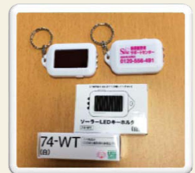
広報グッズ 「ソーラーLEDキーホルダー」 (平成27年度預保納付金で作成)