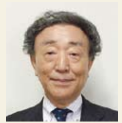
一般社団法人島根被害者サポートセンター