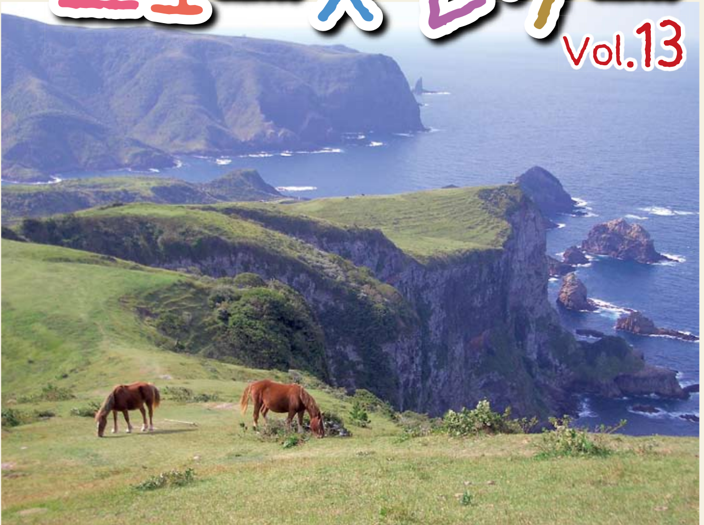
国賀海岸（隠岐郡西ノ島町）