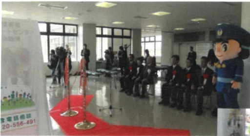
支援自販機設置式 (於：島根運転免許センター)

この支援自販機は企業・施設内などに設置して頂くとその清涼飲料水自動販売機の売り上げの一部が、当センターへの寄付金になるという仕組みです。