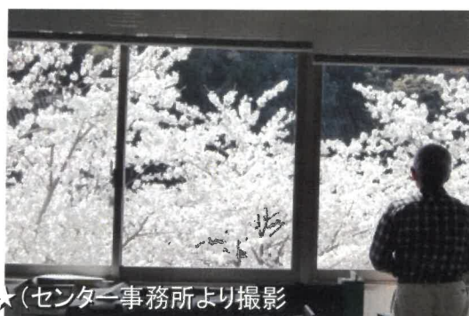
今年も綺麗に咲いてくれました☆(センター事務所より撮影)