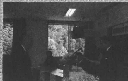
贈呈式（ごうぎん一粒の麦の会様より）