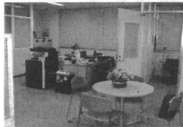
事務局と交流スペース